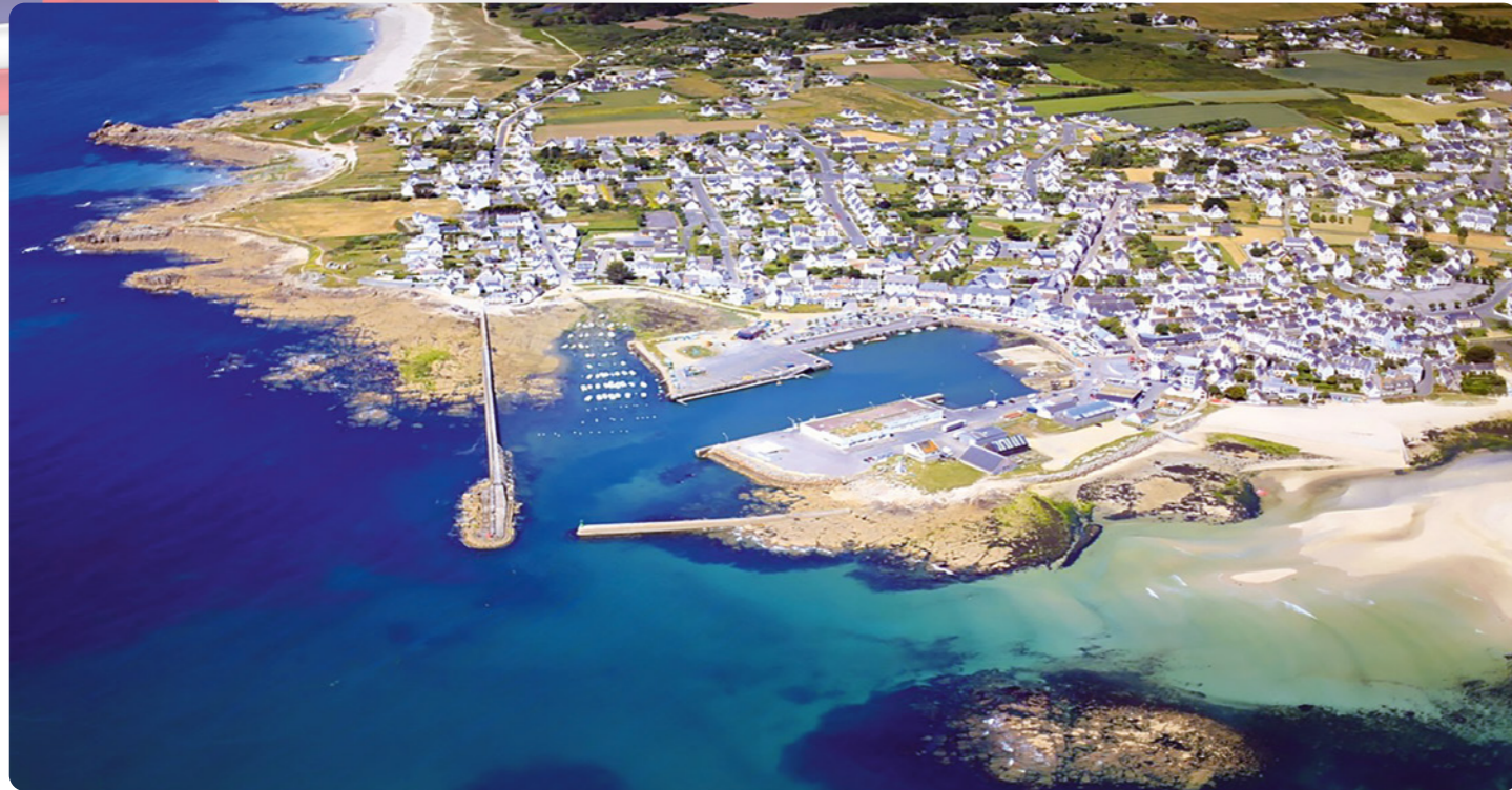
Bis 2001 trug die Gesamtgemeinde offiziell den Namen Plobannaec. Aufgrund der großen Bekanntheit des Ortsteils Lesconil wurde sie dann in Plobannaec-Lesconil umbenannt.