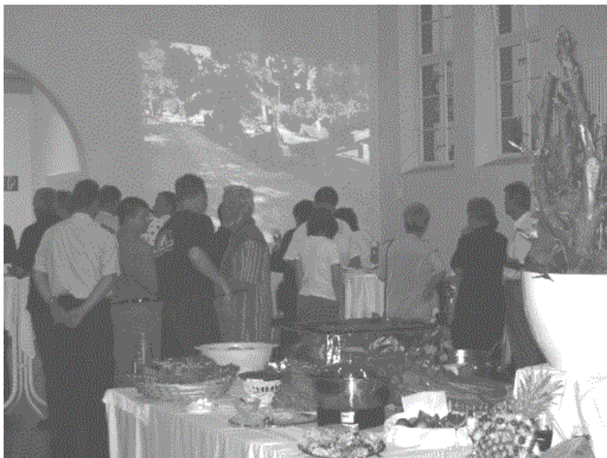
Dia-Show mit den spektakulärsten Bildern der Sturmnacht

Dass dies so ist, und dass wir in Glienicke so schnell vorangekommen sind, verdanken wir der Einsatzbereitschaft vieler Menschen aus unserem Ort und aus anderen Orten.