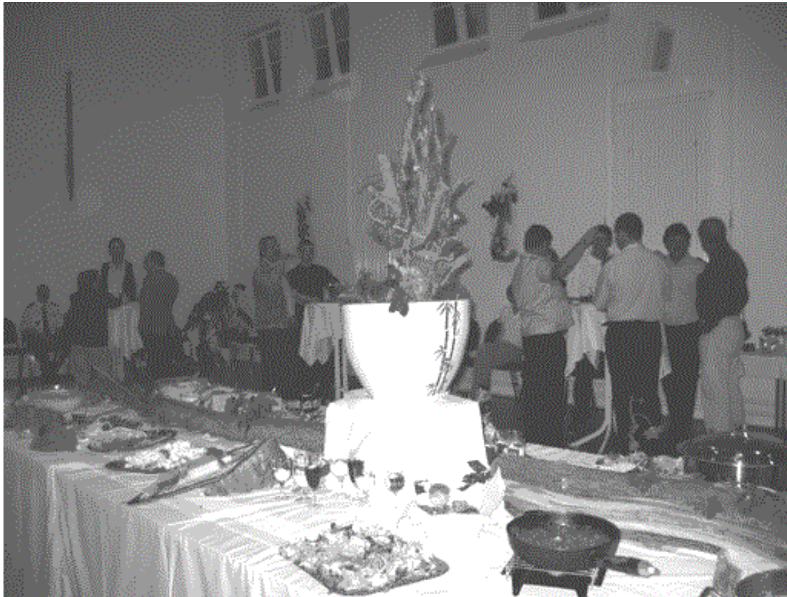
Rustikales Buffet - festlich geschmückt