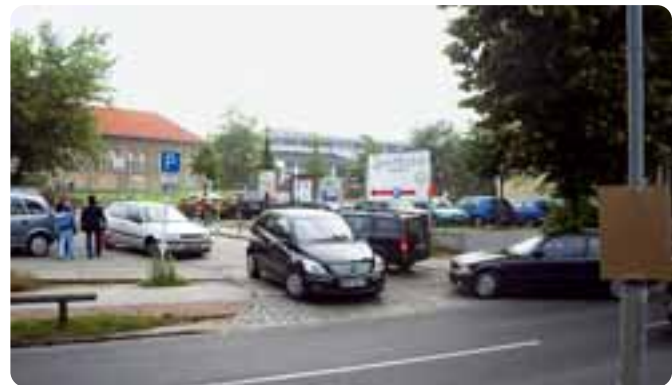
Parkplatz neben der Gesamtschule um 7.42 Uhr.

René Waßmer, VCD-Bundesgeschäftsführer: „Durch Elterntaxis nimmt der Verkehr zu, was die Umwelt belastet und das Unfallrisiko vor den Schulen erhöht. Je mehr Kinder zu Fuß zur Schule gehen, desto sicherer wird der Schulweg. Außerdem lernen die Kinder dadurch, sich im Straßenverkehr eigenständig fortzubewegen.“