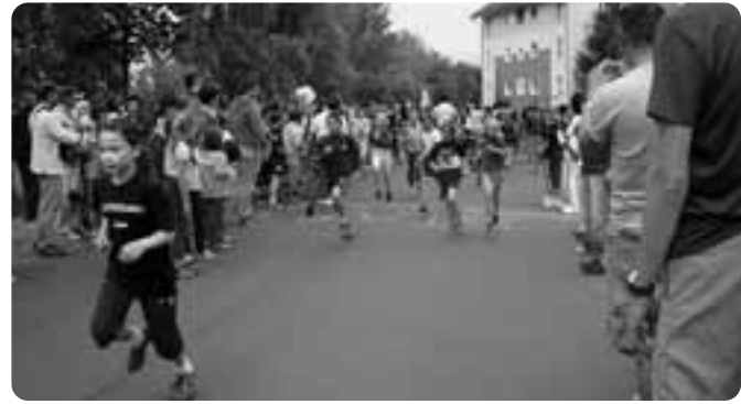
Glienicker Grundschüler laufen für Spenden