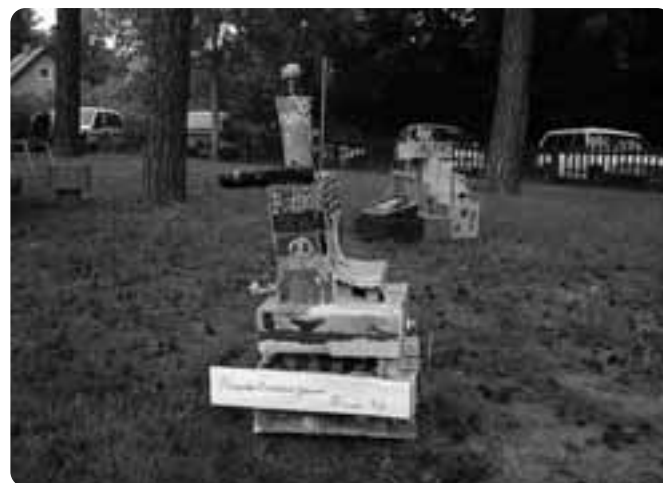
Eines von ganz vielen Kunstwerken der Glienicker Grundschüler

der künstlerisch zu fördern, sie anzuregen, zu ermutigen und zu begleiten, sie im besten Sinne ihren eigenen Ausdruck finden zu lassen. Das, da bin ich mir ihrer Zustimmung sicher, geht weit über die Vermittlung künstlerischer Techniken, die Schulung von Wahrnehmung, räumlicher Orientierung und vieles mehr hinaus. Also, fragen wir erneut, wer begleitet und regt diese Entwicklungen und Prozesse an?