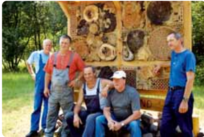
Handwerkliches Geschick bewiesen die Mitarbeiter der Beschäftigungsgesellschaft NOVAREG mit dem Bau von zwei Insektenwänden.

Sechs Monate waren sechs Männer der Beschäftigungsgesellschaft NOVAREG im Naturschutzgebiet Eichwerder tätig. Ihre Aufgabe war es, das Gelände so vorzubereiten, dass hier ein Naturlehrpfad entstehen kann, der an den Naturlehrpfad im Tegeler Fließ in Reinickendorf anschließen wird. Darüber hinaus ist ein Knüppeldamm in Planung. Entstanden sind zwei Sitzgelegenheiten und eine Insektenwand. Eine weitere Insektenwand wurde direkt neben dem Rathaus aufgestellt. Erste Insekten sind schon eingezogen. Wege wurden freigeschnitten und Müll entfernt. Insgesamt sechs Schilder weisen nun darauf hin, dass sich hier ein Naturschutzgebiet befindet. Geschützt wird eine ungefähr 10.000 Quadratmeter große Trockenrasenfläche. Trockenrasen wächst auf Sandböden. Eine Vielzahl von