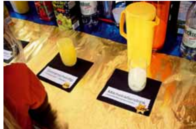
Im All ist alles anders. Mehr hierzu auf Seite 17