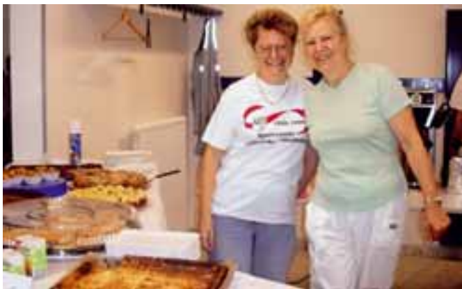
Ganz bezaubernd kulinarisch verwöhnt. Mehr hierzu auf Seite 20