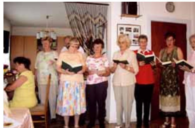
Zum Dank gab's Gesang. Mehr hierzu auf Seite 26