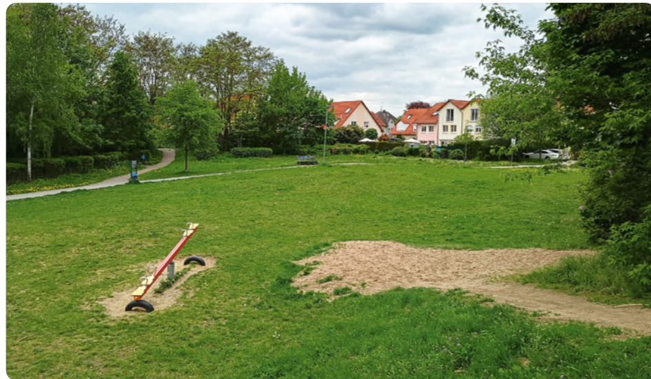
Der Bürgerpark: Ausgleichsfläche für die Bebauung des Sonnengartens, aber der Zustand wirkt trostlos.

Clemens Börsch, sachkundiger Einwohner, sieht nun die Grundstückseigentümer in der Pflicht: „Sie müssen eine Ausgleichsfläche besorgen.“ Rieseberg schlug daraufhin vor, das Verfahren zunächst ruhen zu lassen, bis die Verwaltung eine Antwort von den Eigentümern erhalte. „Bis dahin sollte kein Geld für den B-Plan 26 in den Haushalt eingestellt werden.“