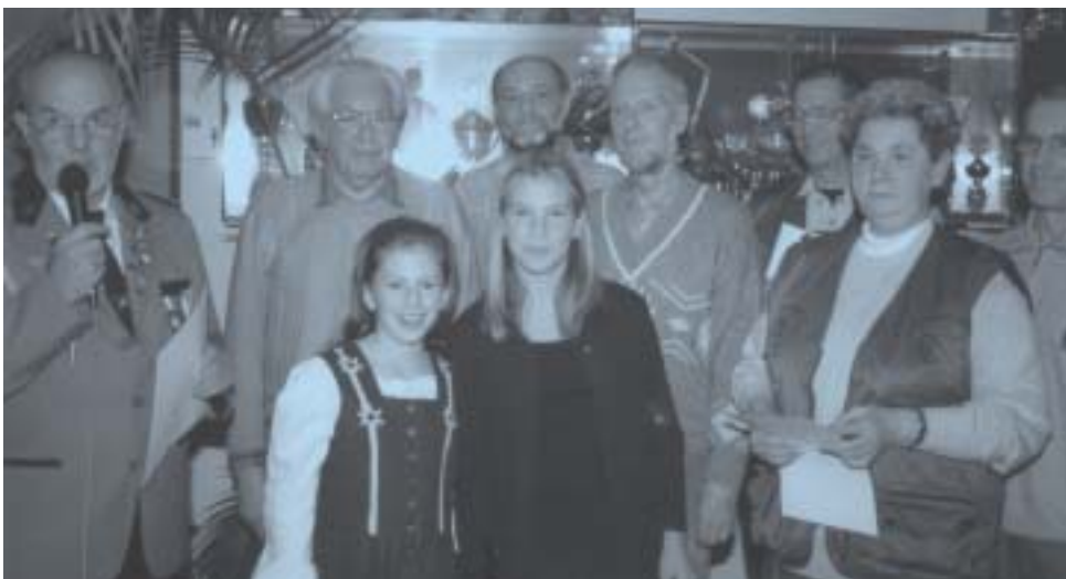
Die Abteilung Sportschießen im SV Glienicke