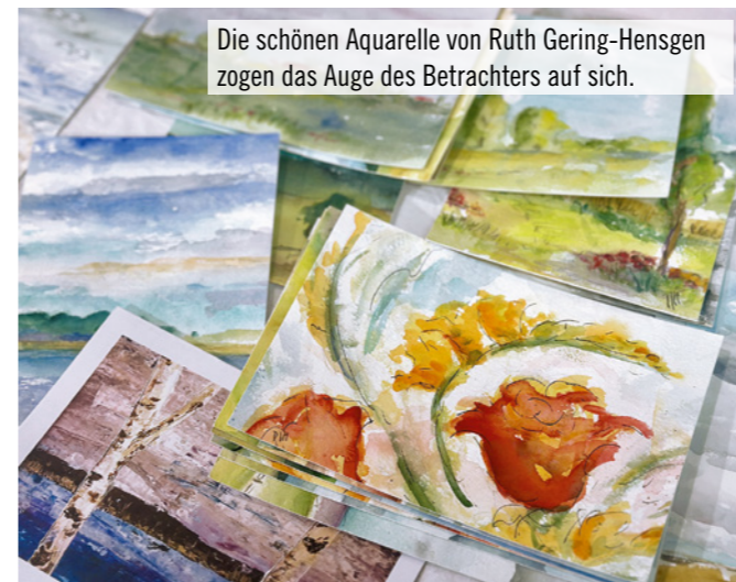
Die schönen Aquarelle von Ruth Gehring-Hensgen zogen das Auge des Betrachters auf sich.