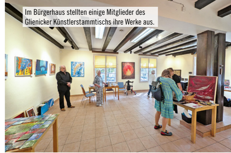
Im Bürgerhaus stellten einige Mitglieder des Glieniccker Künstlerstammtisches ihre Werke aus.

Die „Tage der Offenen Ateliers“ haben einmal mehr gezeigt, wie lebendig und vielfältig die lokale Kunstszene ist – und wie wichtig solche Formate für Begegnung, Austausch und kulturelle Teilhabe sind.