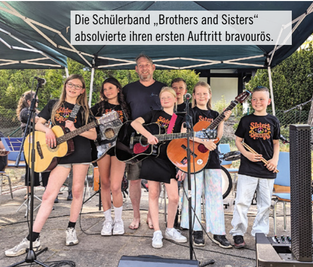
Die Schülerband „Brothers and Sisters“ absolvierte ihren ersten Auftritt bravourös.

Das waren die Offenen Ateliers in Glienicke/Nordbahn