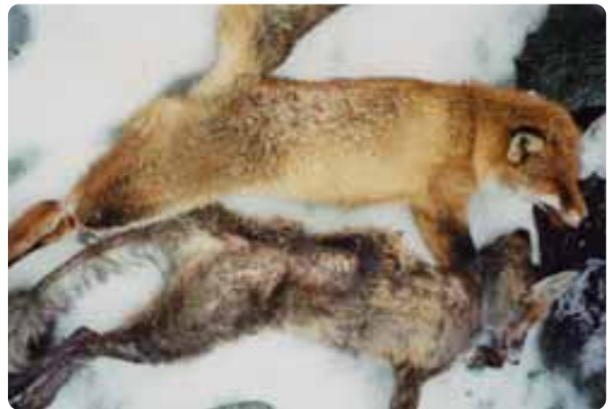
Deutlich ist auf dem Bild der Unterschied zwischen einem gesunden und einem rüdügen Fuchs zu erkennen.

Noch ein Gesundheitshinweis der Jagdbeauftragten: Am Ortsrand, jedoch verstärkt im Eichwerder ist die Fuchsräude aufgetreten. Diese Krankheit kann auch auf Hunde und Katzen übertragen werden. Bitte beachten Sie die Leinenpflicht, die sowieso in diesem Gebiet herrscht.